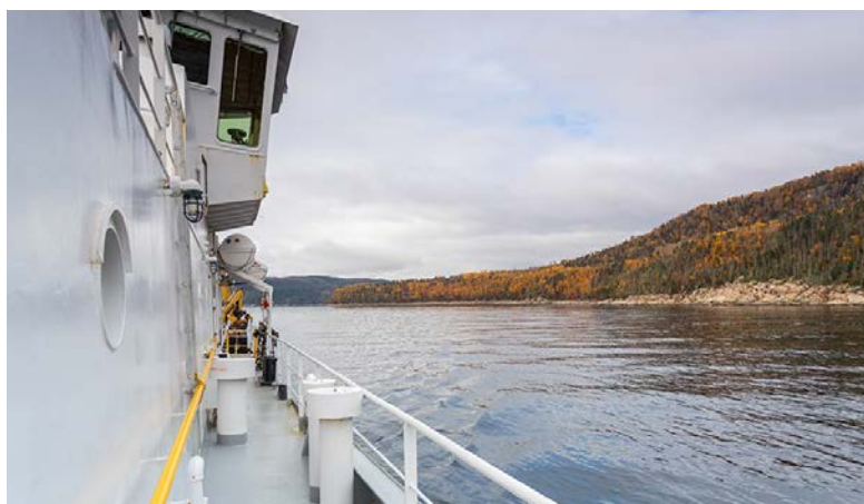
Une des photos de l'exposition À des brasses de profondeur